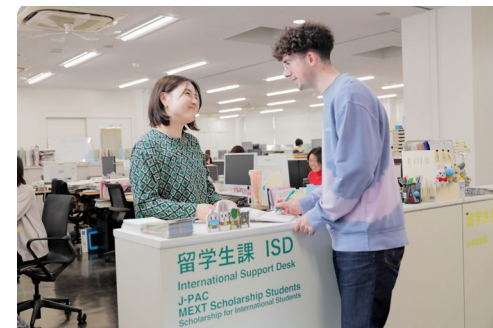
インターナショナル・サポートデスク

大学・大学院卒業後は、大学で日本語、日本文 学の研究者となっている人、日本で就職している 人、国の日系企業で翻訳・通訳に従事している人 など、何らかの形で日本と関わりを持っている人 がほとんどです