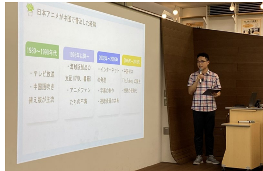
特別研究公開発表会

必修科目「特別研究（文系）A・B」は、9カ月かけて修了レポートを作成する密度の濃い授業です。専門の異なる4名の教員がゼミ形式で指導します。7月には公開発表会を開催し、その成果はレポート集として刊行しています。