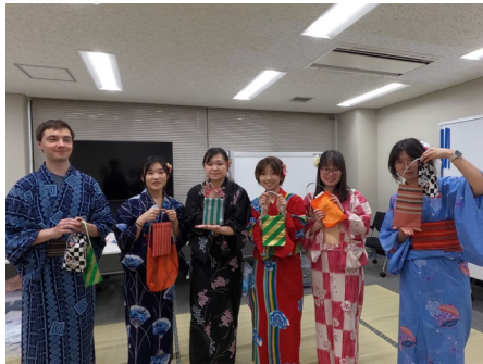
浴衣の着方ワークショップ